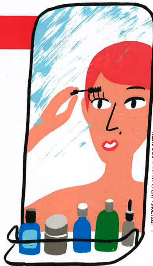
ILLUSTRATIONS : ANTHONY HUCHETTE POUR CAPITAL

Depuis son premier spa à Paris en 2002, la marque de cosmétiques naturels de luxe, toujours aux mains de sa fondatrice Aliza Jabès, en a ouvert 21 autres.